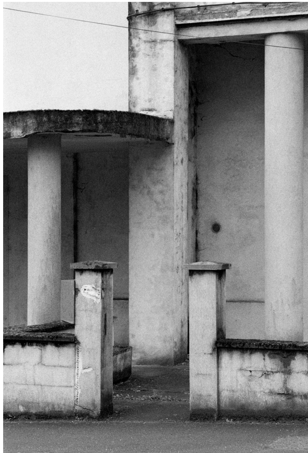
Stephen Dock, Hayange , 2024

Eingeladen von La Chambre zu einem Aufenthalt in der Region Grand Est setzt Stephen Dock seinen in Ulster begonnenen Weg fort, der ihn von Nordeuropa nach Osten führt und die großen Bergbauregionen durchquert. Er interessiert sich für die großen Kathedralen des industriellen Erbes oder die von der modernen Architektur inspirierten Arbeitersiedlungen, aber auch für periphere Gebiete, die sich für eine gründliche visuelle Erkundung eignen, mit einer Fotografie, die zwischen verkohltem Schwarz und Grautönen schwankt, die von gedämpften, manchmal glühenden Farben durchzogen sind.