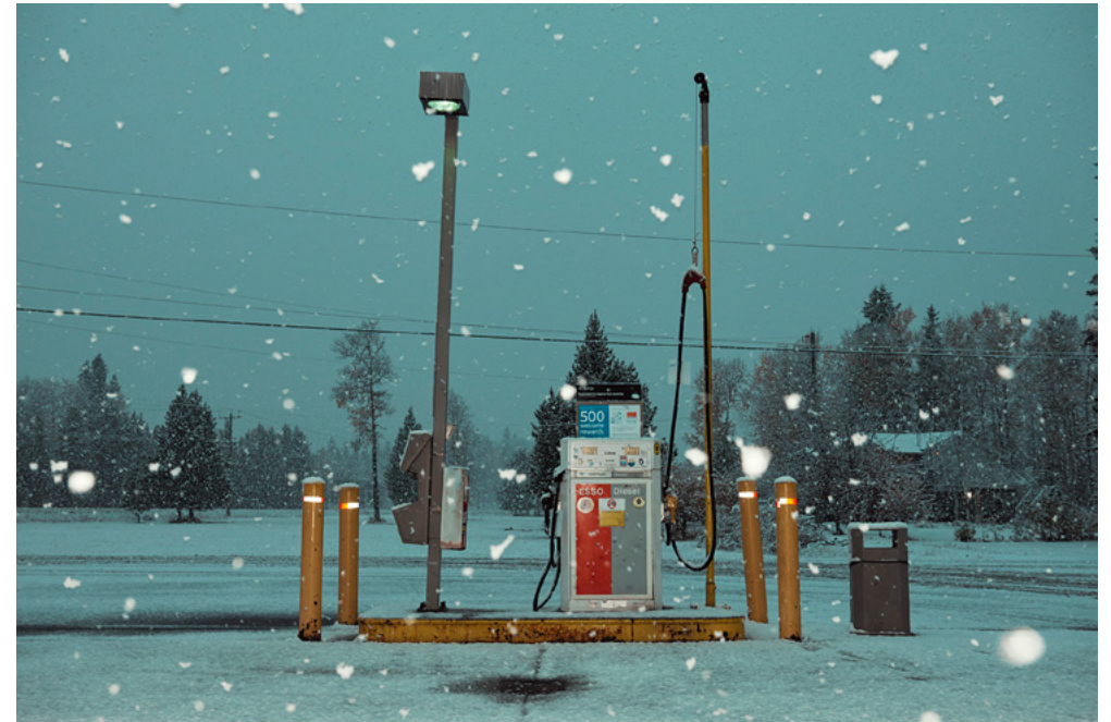
Kourtney Roy, First snowfall , 2017, Série The Other End of the Rainbow .

Beeinflusst von den endlosen Weiten Nordamerikas und den Film Noirs, überrascht Kourtney Roy mit ihren einzigartigen Inszenierungen und Klischees einer rätselhaften Vorstellungswelt. Die vorgestellte Serie, The Other End of the Rainbow , eine Hybridserie zwischen Kunst und Dokumentation, handelt von Frauen, die entlang des Highway 16 im Norden von British Columbia verschwunden sind.