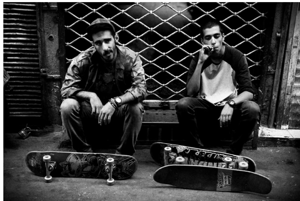
Mathias Zwick, Une poussée vers l'Ouest , 2015

Die Olympischen Spiele, die Frankreich im Jahr 2024 ausrichtet, haben die Sportfotografie wieder in den Vordergrund gerückt. Beim Skateboarding, das vor kurzem olympische Sportart wurde, zeugt die Fotografie von der Leistung, aber auch von ihrem Lebensstil. Die Ausstellung im Jardin des Deux Rives, die in Zusammenarbeit mit Nouvelle Ligne, dem Veranstalter des NL Contest, konzipiert wurde, zeigt Bilder von Mathias Zwick und Loïc Laforge, die sich mit Skateboarding und der Jugend in Ländern befassen, die von politischen Spannungen geprägt sind (Iran und Westjordanland). Diesen Bildern werden Visualisierungen gegenübergestellt, die von dem Fotografenteam aufgenommen wurden, das beim NL Contest 2024 dabei war. Sie geben die Atmosphäre der Veranstaltung und den spektakulären Charakter der ausgeführten Tricks wieder.