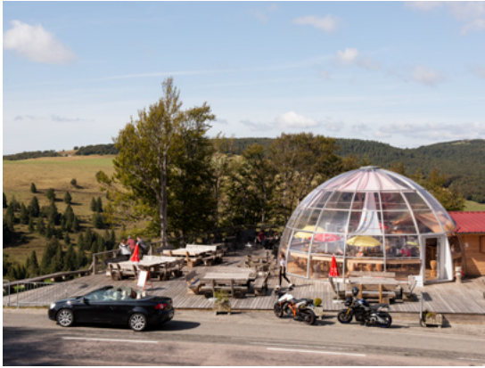
Bertrand Stoffeth, Hyperlendemains , 2020