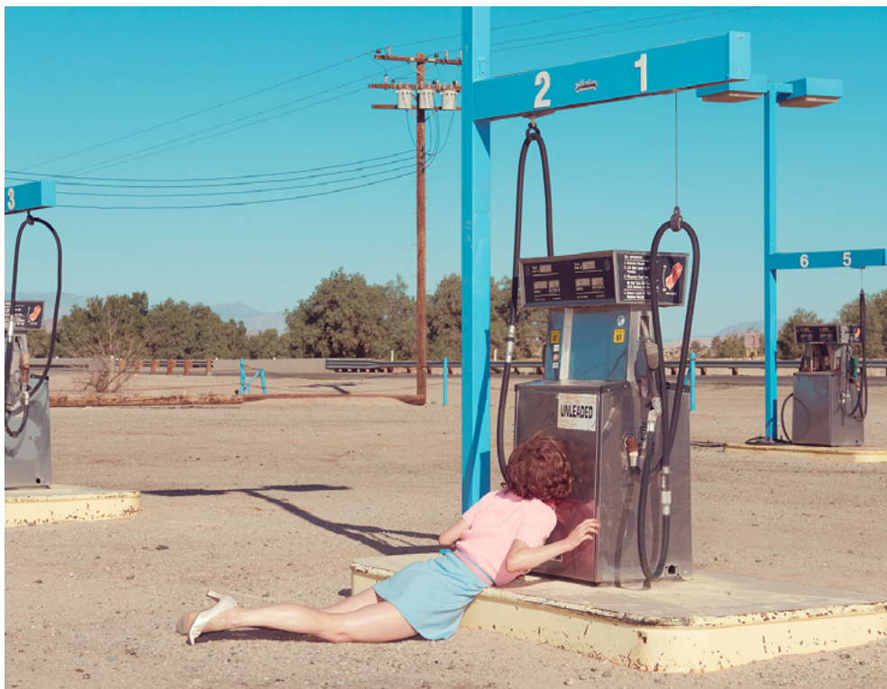
Kourtney Roy, Enter As Fiction No. 16 , 2015.

Kourtney Roy est une photographe surprenante. Sa dernière série, The Other End of the Rainbow , présentée à La Chambre en avril 2025, est un road trip d'investigation le long de la Highway 16 – lieu d'homicide et de disparition de nombreuses femmes, en majorité originaires des Premières Nations. Il est fait de rencontres avec ceux et celles que le drame a touchés, et de perspectives sur ces contrées immenses du nord de la Colombie-Britannique. Les paysages sont peut-être le trait d'union qui relie ce travail documentaire à ceux réalisés jusqu'alors : une photographie pop et colorée, mettant en scène un personnage fictionnel dans les décors mythiques de la culture nord américaine – station essence, Golden Gate Bridge, voie ferrée, super héros